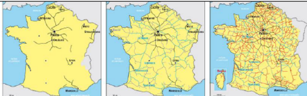
Evolution du réseau ferré au cours de la seconde moitié du XIX e siècle. Doc. 3